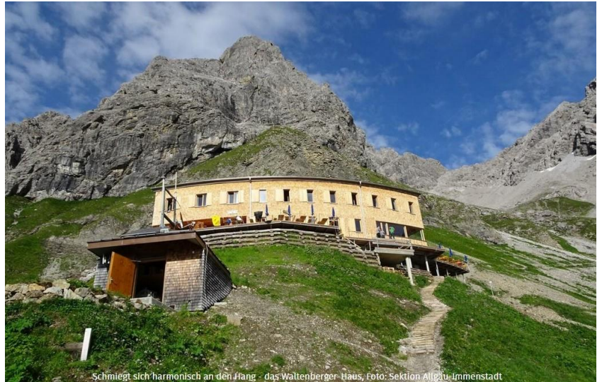
Schmiegt sich harmonisch an den Hang - das Waltenberger Haus

Auf eine schöne Bergtour, freuen sich eure Fritzen